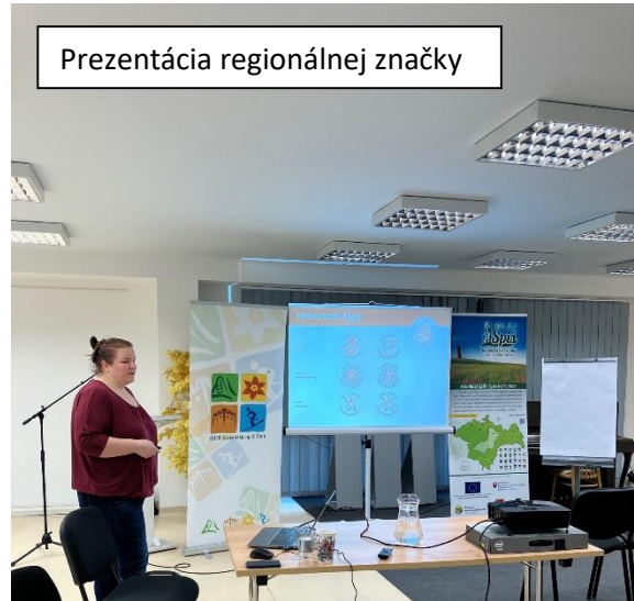
Prezentácia regionálnej značky