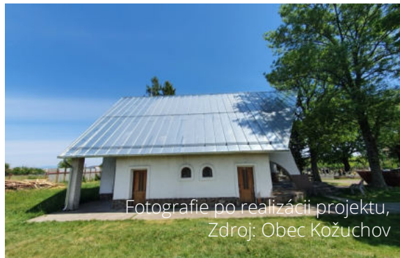
Fotografie po realizácii projektu, Zdroj: Obec Kožuchov