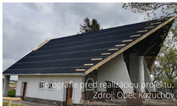
Fotografie pred realizáciou projektu