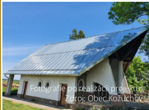
Fotografie po realizácii projektu

ným službám. Súčasťou projektu sú prvky zelenej infraštruktúry v rozsahu podľa rozpočtu projektu (výsadba kríkov, drevín výsev trávnik). Primárnym cieľom projektu bolo zlepšenie kvality života na vidieku, podpora miestneho rozvoja a dosiahnutie pozitívnych zmien v obci. Realizáciou projektu sa posilnila vybavenosť územia, zlepšil sa nielen vizuálny charakter obce, ale i kvalita miestnej infraštruktúry.