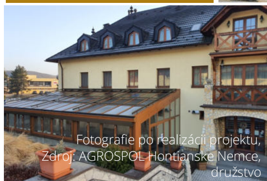
Fotografie po realizácii projektu, Zdroj: AGROSPOL Hontianske Nemce, družstvo