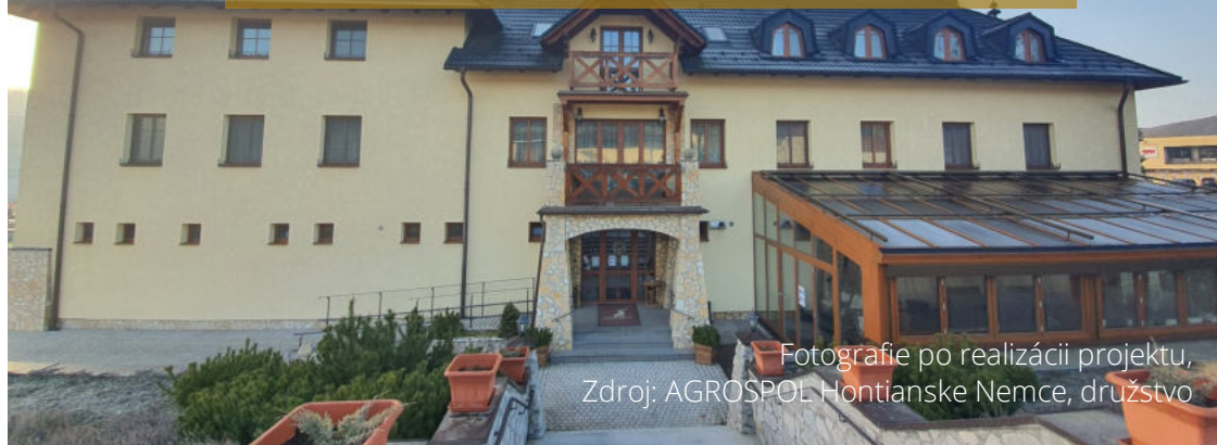
Fotografie po realizácii projektu, Zdroj: AGROSPOL Hontianske Nemce, družstvo