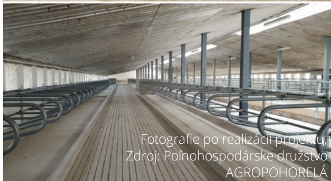
Fotografie po realizácii projektu, Zdroj: Poľnohospodárske družstvo AGROPOHORELÁ