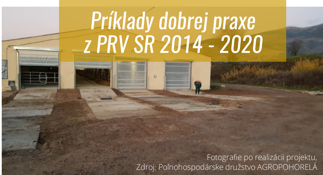
Fotografie po realizácii projektu