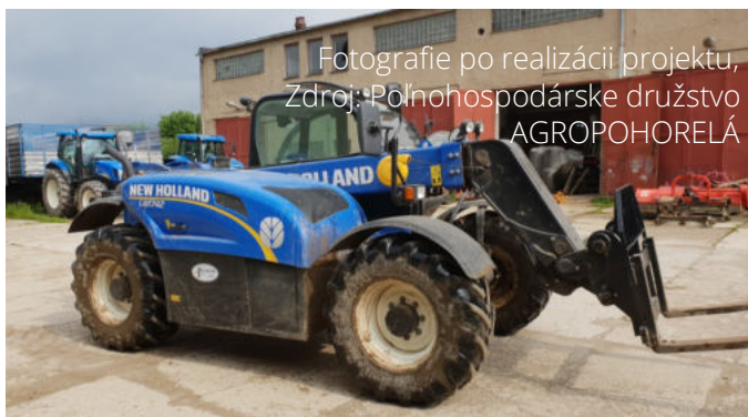
Fotografie po realizácii projektu

Cielom bolo zvýšiť efektivitu všetkých výrobných faktorov a dosiahnuť nárast pridanej hodnoty poľnohospodárskeho podniku. Zvýšiť energetickú efektívnosť a úspory v pôdohospodárstve. Efektívnejšie využívanie kapacity výroby. Zvýšenie úžitkovosti zvierat, stabilizácia kvality produkcie. Aplikácia vhodnejších chovateľských a technologických systémov v živočíšnej výrobe. Zabezpečiť trvalý ekonomický rozvoj a stabilitu podniku. Podieľať sa na neustálom zlepšovaní welfare zvierat.