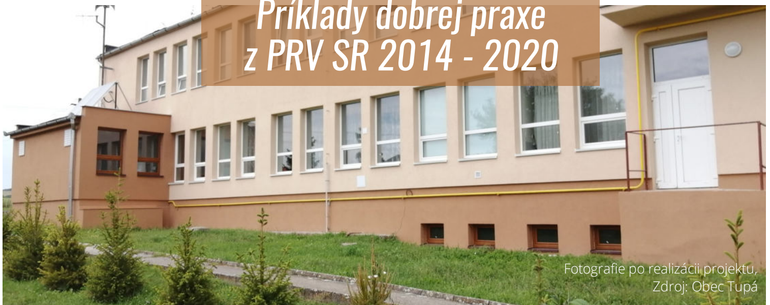
Fotografie po realizácii projektu, Zdroj: Obec Tupá