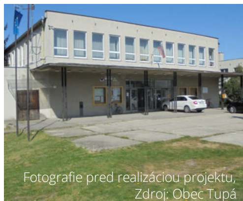
Fotografie pred realizáciou projektu